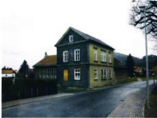
Ansicht von der Sondraer Straße

Dokumentation Bestand Vereinshaus Sättelstädt