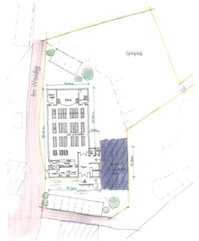
BV: Anbau einer Multifunktionshalle an die vorhandene Kulturscheune in Geismar - Grabentwurf 1 -

Legenplan 1:250 KRAUS INGENIEUR & ARCHITECTEN Görsche Straße 20 / 11111 30466 DERMBACH 26.01.2016