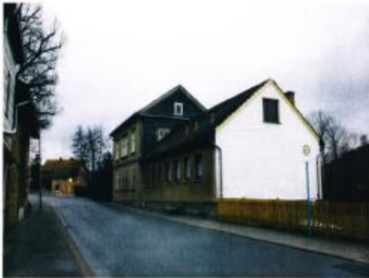
Ansicht von der Sondraer Straße