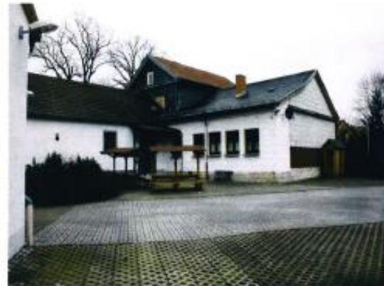
Ansicht von der Hofseite